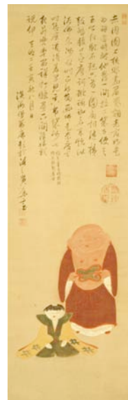
「伏見人形図」伊藤若冲 細見美術館蔵

伏見稲荷のお土産として古くから人々に親しまれてきた伏見人形。近くに住んだ晩年の伊藤若冲は、数多く描いたそうです。このたび、若冲画をもとに、京都・五条坂の六兵衛窯が陶人形「若冲布袋」を製作しました。明るくあたたかな雰囲気と無心に笑う姿は、若冲の絵そのもので、見ている私たちの心も和ませてくれます。ぜひこの機会に開催中の展覧会「細見美術館アートキャンパス2010」に、展示されている若冲の「伏見人形図」と見比べてみてください。どちらもとっても可愛らしい顔をされていますよ！