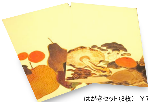
はがきセット(8枚) ¥735 佐野市立吉澤記念美術館蔵・重要文化財「葉蟲譜」をデザインしたはがきのセット。ユニークなモチーフは若冲ならでは！