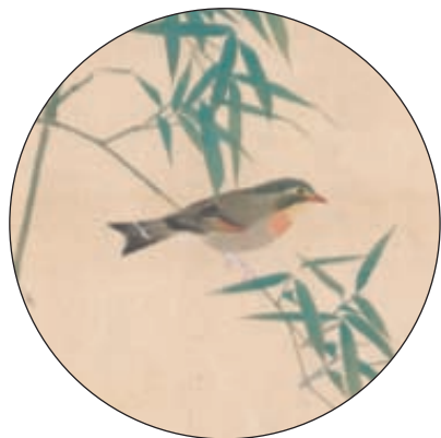
円山応挙筆 若竹に小禽図 部分

個性的な絵師たちが住み、活躍した当時の様子を想像しながら、アートの町・京都を散策してみたいかたがでしょうか。