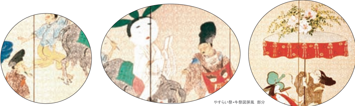
やすらい祭・牛祭図屏風 部分

さらに、よく見ると牛を引く人間の衣服と牛の胴体と同じ文様になっています。これは地紙に雲母 きら 刷りされた菊唐草の唐紙を使用しているからです。その文様を着物の柄に見立てるといふ趣向が凝らされています。