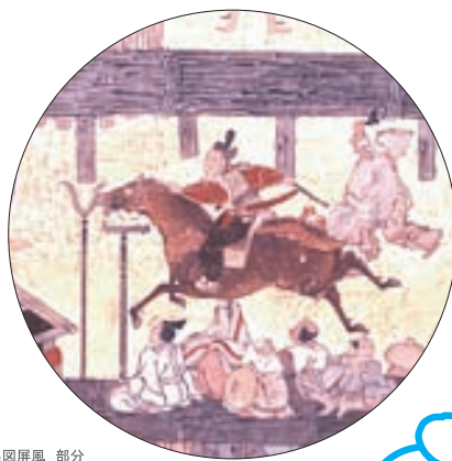
賀茂社競馬図屏風 部分

現在でも実際の走路には「馬出しの桜」「勝負の楓」等、幾つかの目印となる木があります。恐らくこの屏風の5扇目に描かれている柵で囲まれた楓が、ゴール手前の「勝負の楓」と一致すると思われます。