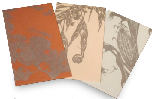
ポチ袋(4種類・各3柄) ¥368 青裳堂書店蔵『玄圃瑤華』をデザインしたポチ袋のセット。 額に入れてお部屋のインテリアにしてみるのもオススメです。