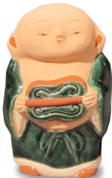
六兵衛窯「若冲布袋」¥7,980 高さ9.5cm

伏見稲荷のお土産として古くから人々に親しまれてきた伏見人形。近くに住んだ晩年の伊藤若冲は、数多く描いたそうです。このたび、若冲画をもとに、京都・五条坂の六兵衛窯が陶人形「若冲布袋」を製作しました。明るくあたたかな雰囲気と無心に笑う姿は、若冲の絵そのもので、見ている私たちの心も和ませてくれます。ぜひこの機会に開催中の展覧会「細見美術館アートキャンパス2010」に、展示されている若冲の「伏見人形図」と見比べてみてください。どちらもとっても可愛らしい顔をされていますよ！