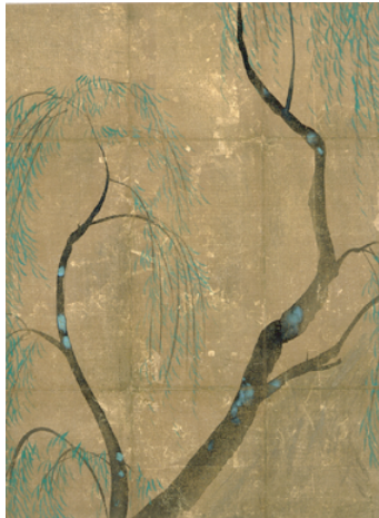
尾形光琳 柳図香包