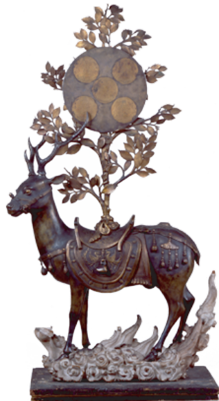
重要文化財 金銅春日神鹿御正体