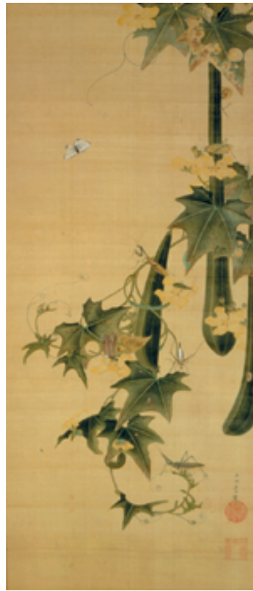
伊藤若冲 糸瓜群虫図