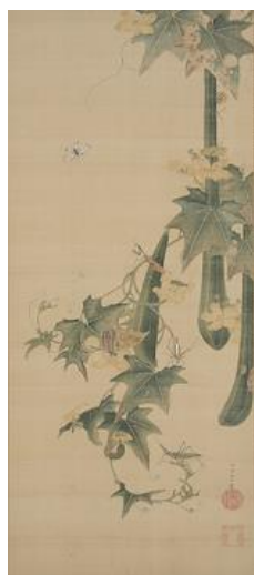
伊藤若冲 糸瓜群虫図 1幅 細見美術館蔵