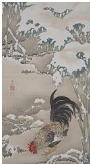
伊藤若冲 雪中雄鶏図 1幅 細見美術館蔵