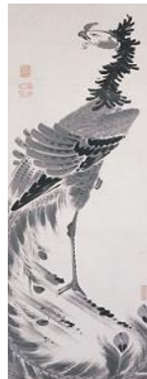
伊藤若冲 鳳凰之図 1幅 相国寺蔵