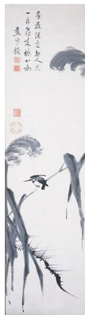
伊藤若冲 芦花翡翠図 1幅 大光明寺蔵