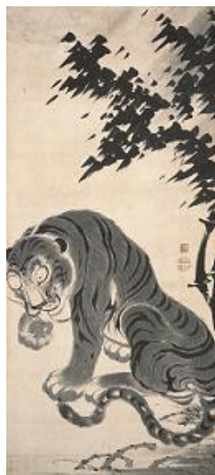
伊藤若冲 竹虎図 双幅のうち左幅 鹿苑寺蔵