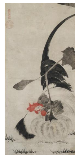
白歳 南瓜雄鶏図(部分) 1幅 宝蔵寺蔵