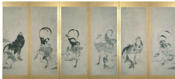
伊藤若冲 鶏図押絵貼屏風(部分) 江戸中期 細見美術館蔵

様々なポーズで描かれた若冲お得意の鶏たち。 筆勢、墨の濃淡によって動きのある表情が活写されている。 孤を描く尾羽は流麗なミクの髪の毛の流れに呼応する。