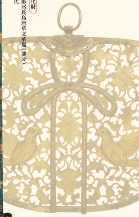
重要文化財 金銅透彫尾長鳥唐草文華蓋(部分) 鎌倉時代