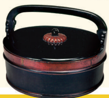
重要美術品 根来菜桶 徳治二年(1307)銘