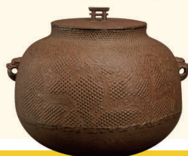
重要文化財 芦屋叡地楓園真形釜 室町時代