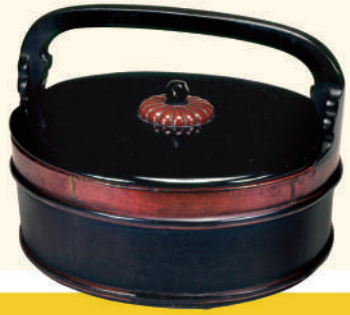
重要美術品 根来菜桶 徳治二年(1307)銘