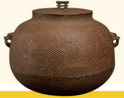
重要文化財 芦屋叡地楓園真形釜 室町時代