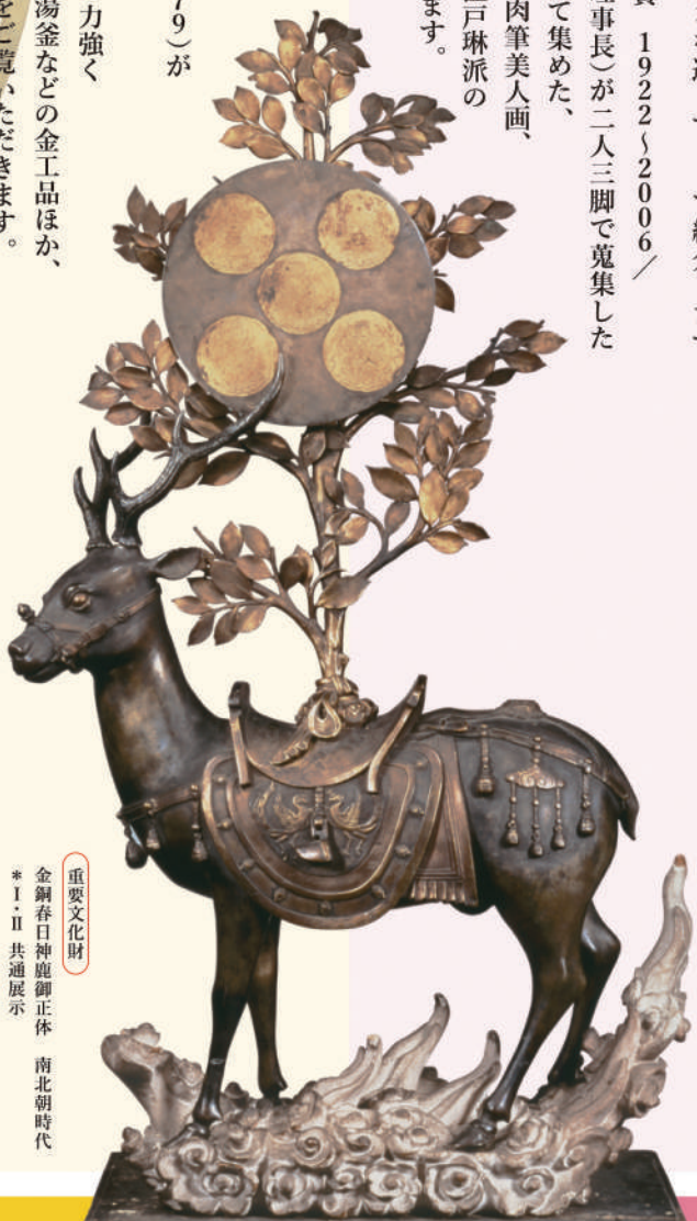
重要文化財 金銅春日神鹿御正体 南北朝時代 *Ⅰ・Ⅱ 共通展示