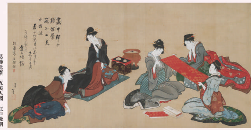
葛飾北斎 五美人図 江戸後期