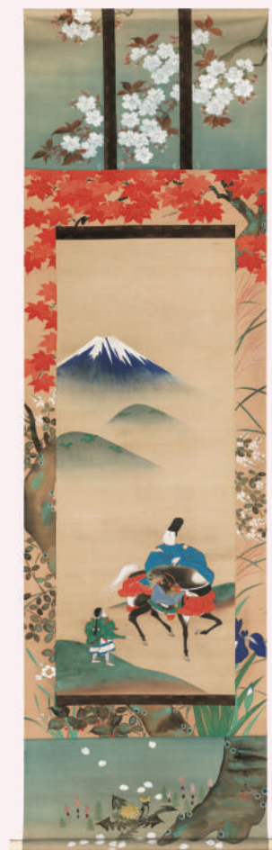
鈴木守一 業平東下り図 江戸後期/明治時代