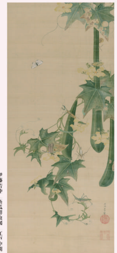
伊藤若冲 糸瓜群虫 江戸中期