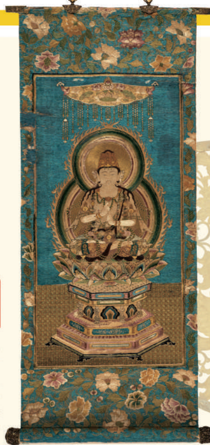
重要文化財 刺繍大日如来像 鎌倉時代