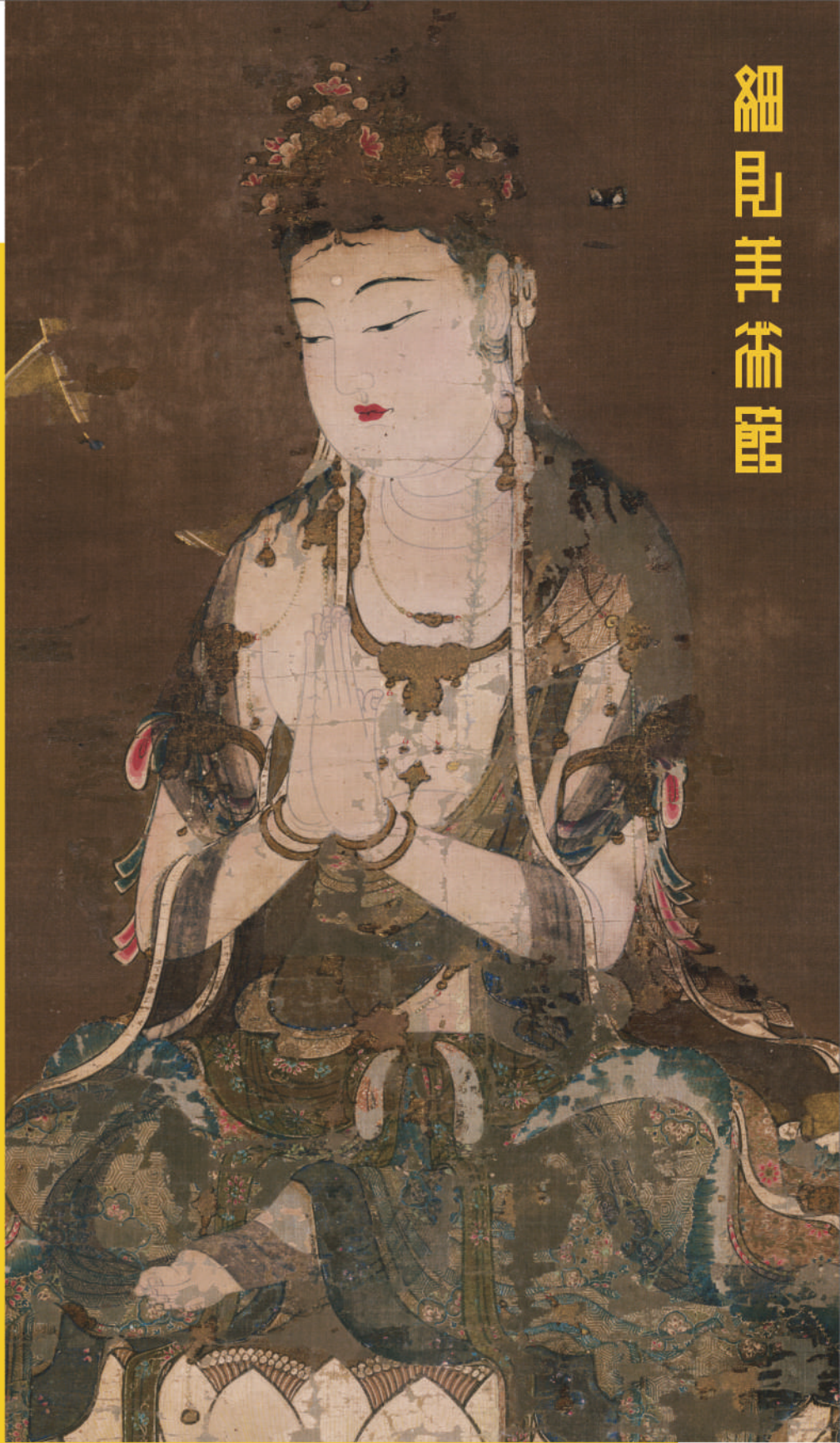
普賢菩薩像(部分) 平安後期 細見美術館蔵