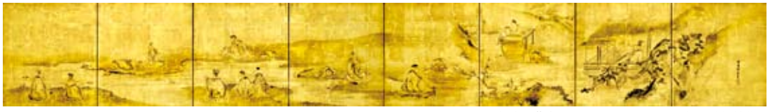
鶴沢探索 蘭亭曲水図屏風 江戸中期 細見美術館蔵

これからの展覧会 澤乃井 櫛かんざし美術館所蔵 ときめきの髪飾り — おしゃれアイテムの技と美 — 2024年4月27日(土)～8月4日(日)