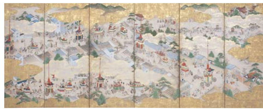
祇園祭礼図屏風 江戸前期 細見美術館蔵 【後期展示】