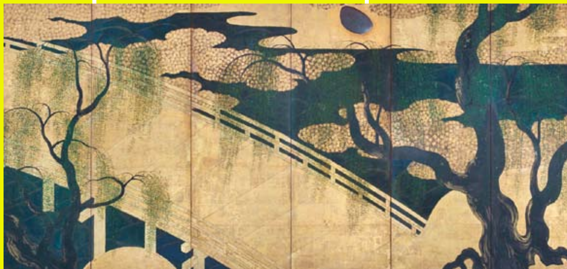
柳橋水車図屏風 江戸前期 個人蔵