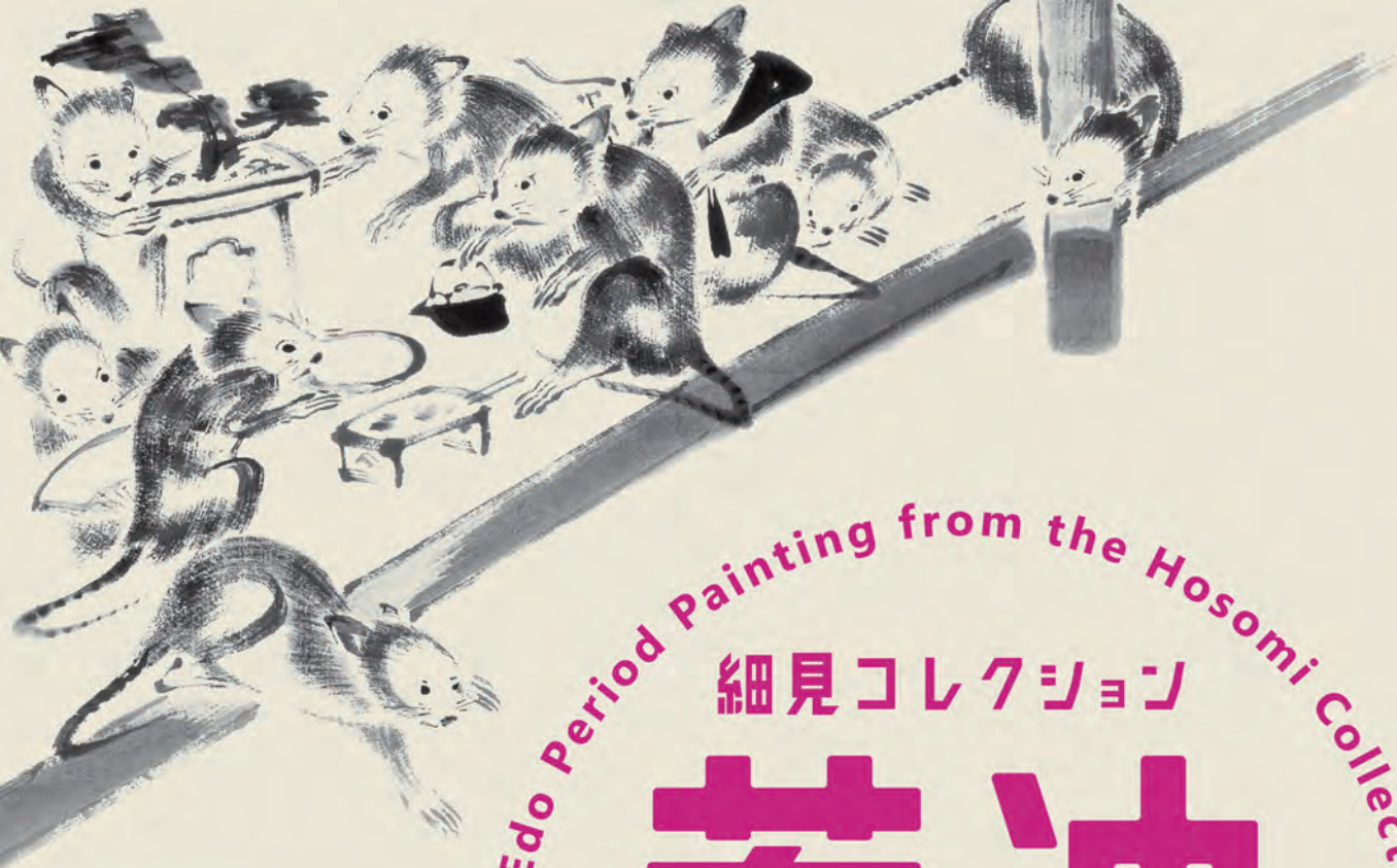
伊藤若冲 《鼠婚礼図》(部分) 寛政8年(1796)頃

Jakuchu and Edo Period painting from the Hosomi Collection