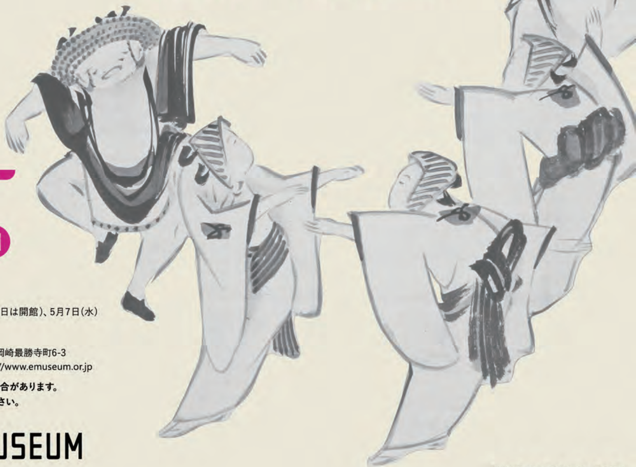
伊藤若冲 《踏歌図》(部分) 江戸中期