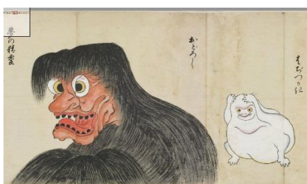
⑤北斎季親 「化物尽絵巻」(部分)