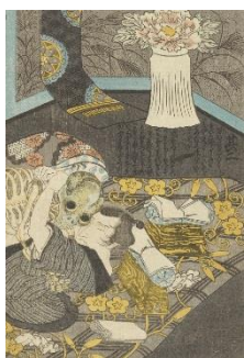
①初代歌川豊国 『絵本開中鏡』(部分)

※画像ご使用の際は、それぞれクレジット表記を必ずお願いいたします。 ※広報画像は、部分使用が可能です。誌面構成に合わせてトリミングをしてください。