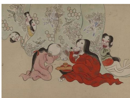
②[英一蝶] [妖怪絵巻](部分)