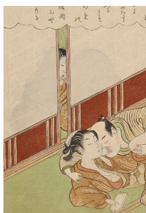
⑧鈴木春信 「風流座敷八景」(部分)