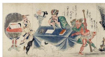
⑥絵師不明 「地獄草紙絵巻」(部分)