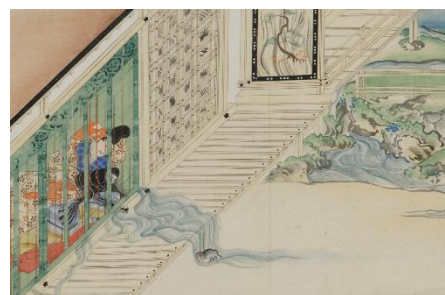
③福田太華(写) 「長谷雄草紙」(部分)