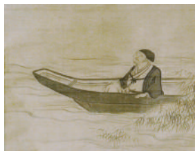
志野流初代志野宗信画像(部分) 江戸時代 松隠軒蔵