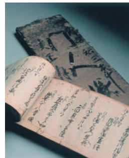
諸国香道門人帳・門人帳 江戸時代 松隠軒蔵