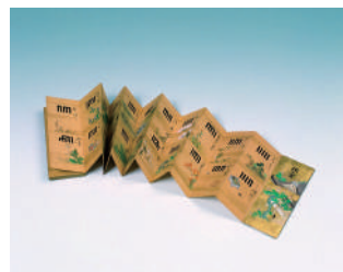
源氏香図本 土佐守光貞画 江戸時代 松隠軒蔵