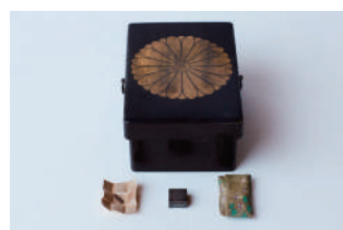
志野流伝来 名香「蘭奢待」 松隠軒蔵